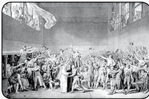
Orduko Frantzez Aberri Batzarra

Frantziko iraultza, errigizartearen jaurkintzarako bear ziran lege ta tresnerizko izan gaitasunak, euren almenezko asken mugaraiño eldu ziralako asi zan, errigizartearen bizitza, politikazko arazo andi baten biurtuz.